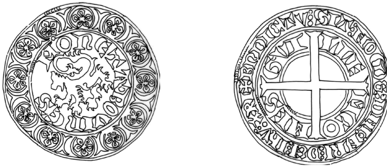
Gros d'argent de Guillaume I er comte de Namur 14 e s. Monnaie frappée à Bouvignes. Dessin Maggy Destrée

🕒 Compare cette monnaie médiévale à une pièce de 2 €.