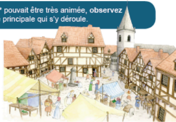
Évocation d'une place médiévale, illustration A. Bresnai, 2021

Au centre de la place se trouve une pompe à eau datant du 19 e siècle. Elle est le témoin d'une époque où l'eau courante n'était pas encore disponible dans la plupart des maisons.